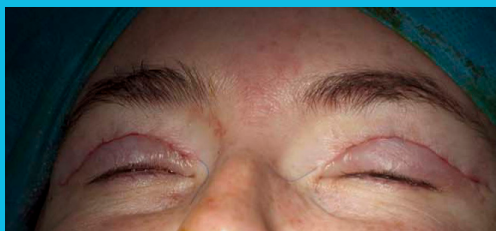
Místa jsou sešita jemným plastickým stehem.