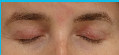
Tři měsíce po zákroku jsou jizvy téměř nedohledatelné.